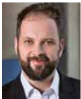
Ihr Tobias Eschenbacher Oberbürgermeister

Nicht nur die Stadtverwaltung, auch private Haushalte, (Hoch-)Schulen oder Pfarreien achten beim Einkauf auf Produkte mit dem Fairtrade-Siegel. Große und kleine Aktionen, dankenswerterweise auch die Thematisierung in diesem Semesterprogramm der vhs, erinnern an die Idee, Bedeutung und Ziele des fairen Handels. Nutzen Sie die Möglichkeiten, sich zu informieren – vielleicht wollen Sie dabei sein. Auch kleine Schritte zählen!