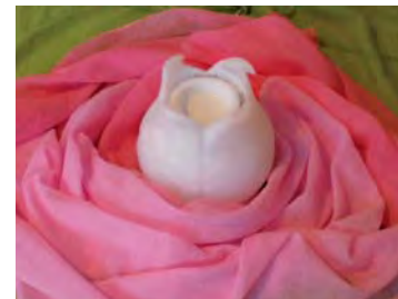
Klangreise Rose & Melisse